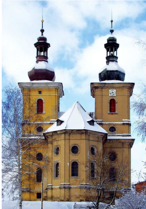
Kostel Nanebevzetí Panny Marie