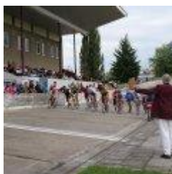
Tréninky a závody v Plzni

Naši závodníci musí jezdit trénovat na dráhu do nejbližší Plzně cca 100km, v zimním období až do Prahy, kde je jediná zimní dráha v Motole 153,8m dřevo. Dále je v ČR velodrom zastřešený v Brně 400m beton a Praha Třebešín 333m beton. Ubytovací kapacita velodromu v Motole je 32 osob. Naše sportovní centrum mládeže pořádá pravidelně každý rok týdenní soustředění o jarních prázdninách a v období říjen až březen prodloužené víkendy tréninků na dráze, jednou měsíčně a tato ubytovací kapacita je vždy plně obsazena.