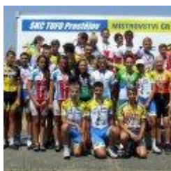
Vítězové z MČR