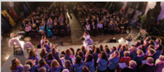
Benefiční vánoční koncert na Kozlu, 30.11.2013