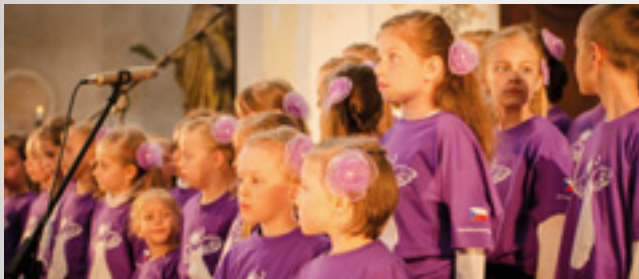
Benefiční koncert Plasy, 18.05.2013