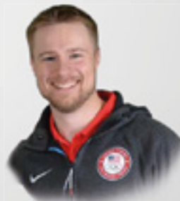
Matthew EMMONS sportovní střelec, USA, olympijský vítěz