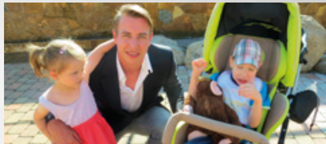
Golfový turnaj Dýšina, 21.06.2013