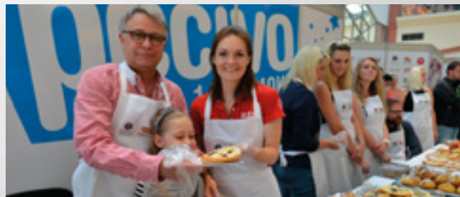
Hvězdná pekárna, 20.06.2014