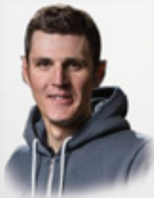
Jaroslav KULHAVÝ profesionální cyklista, olympijský vítěz, mistr světa