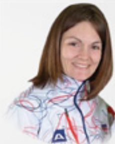
Kateřina EMMONS sportovní střelkyně, olympijská vítězka, mistryně Evropy