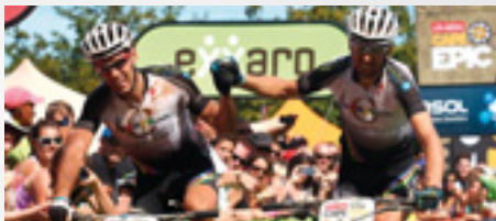
Christophe SAUSER, Švýcarsko, Specialized